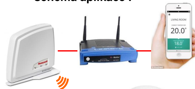
schéma aplikace :

Napájení Baterie 2x 1,5V (AA) alkalické, životnost 2 roky Výstup SPDT (bezpotenciálový kontakt) Protimraz. ochrana