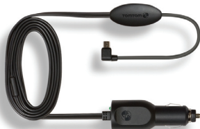
Přijímač dopravních informací RDS TMC