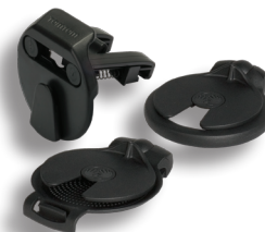
Držák do ventilace